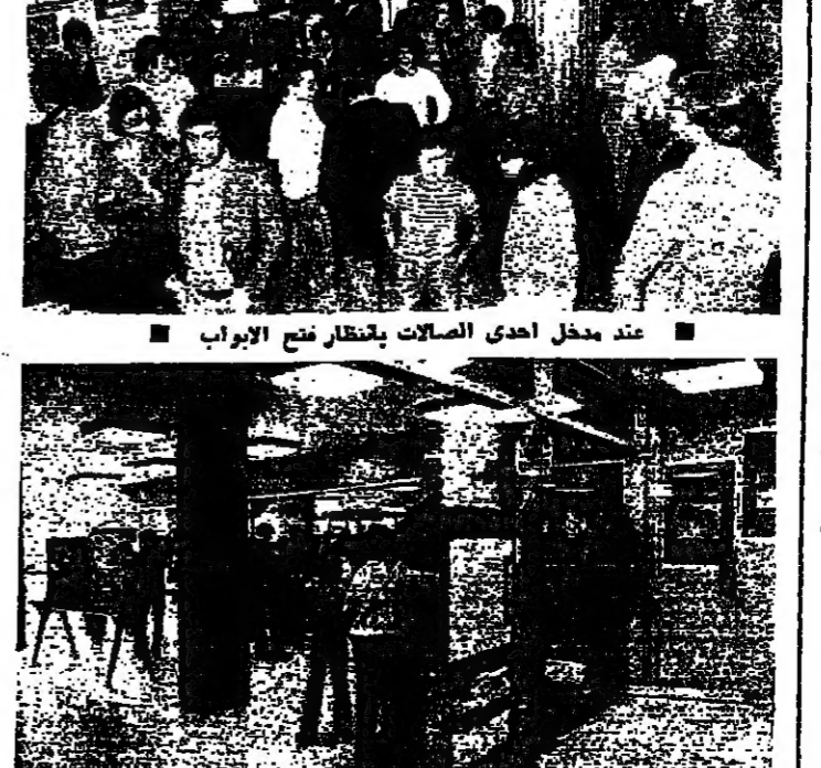
على شبكة الذاكر في احدى صالات الحمراء

تأجيل المحكمة بجوانت طرابلس ارجا المجلس العفني امس جلسة المرافعات بقضية أعضاء « حركة ٢٤ تشرين الديمقراطية » الموقوفين بجوانت طرابلس السليفة ، مع الالهم طنوس فرنجية ، والتي كانت مقررة امس السبت ، الساعة ٢٦ نيسان الجاري ، بسبب تضرر نقل الموقوفين من السجن الى قصر العدل .